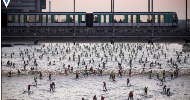
روی رود سن