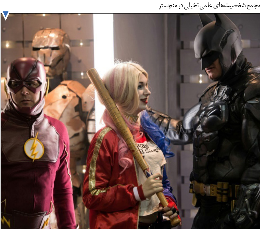
مجمع شخصیت‌های علمی تخیلی در منچستر