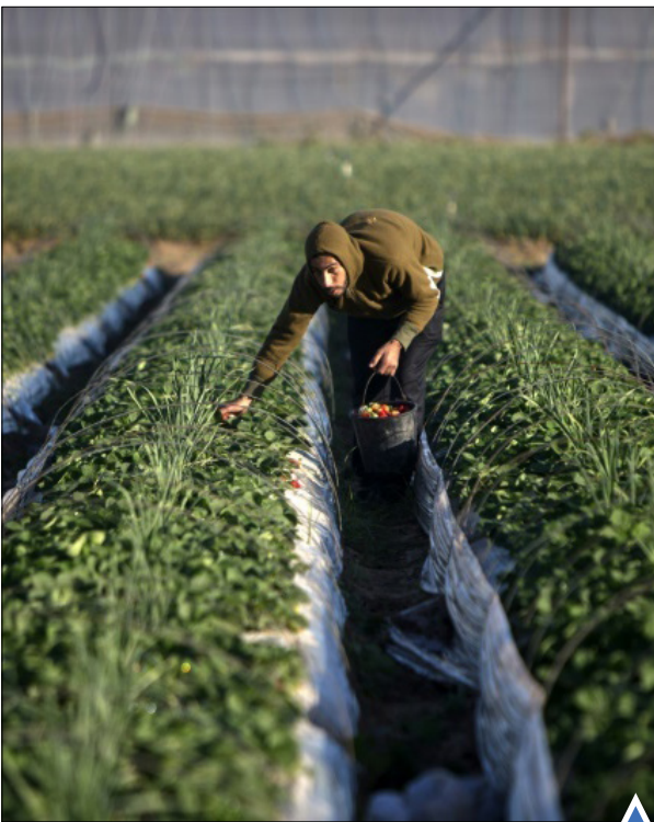
کشاورز فلسطینی در نوار غزه