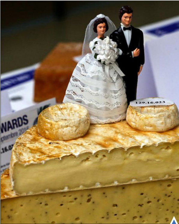
مسابقه انتخاب بهترین پنیر سوئیس