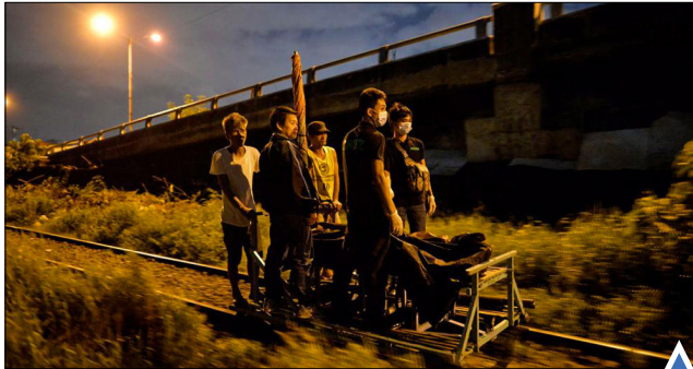
مبارزه با مواد مخدر

وضعیت پناهجویان سوری در خارج از مرزهای این کشور