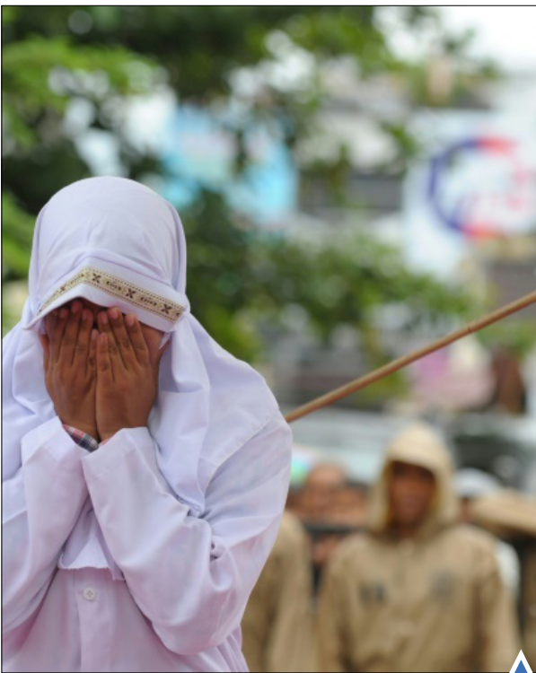
اجرای حد به دلیل رابطه غیرشرعی در باندا آسه