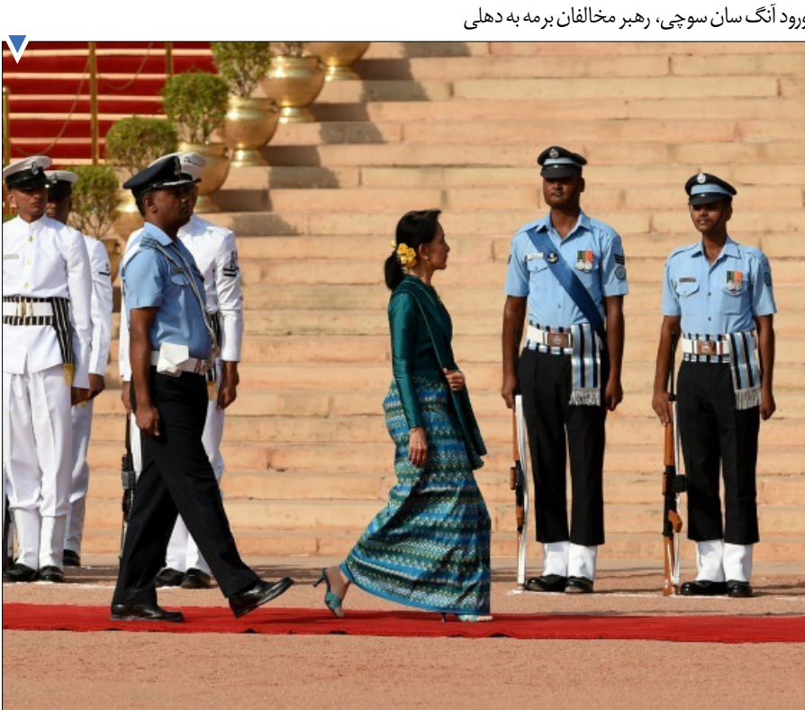
ورود آنگ سان سوچی، رهبر مخالفان برمه به دهلی