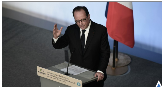
رئیس‌جمهور فرانسه در حال سخنرانی