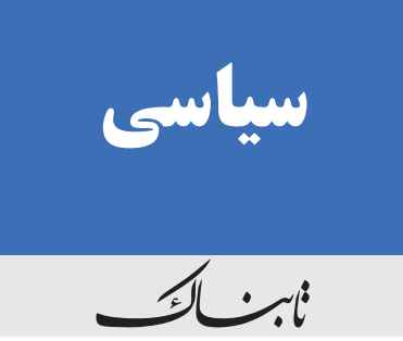
«سیاسی» در «نابناک»