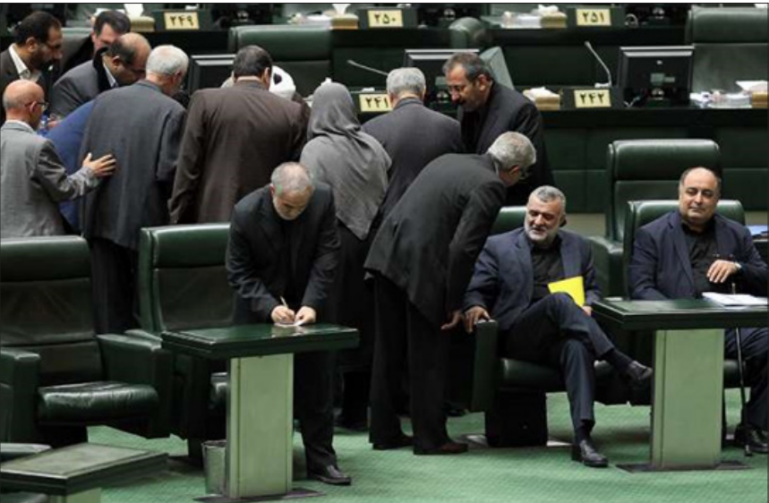
وزیر جهاد کشاورزی