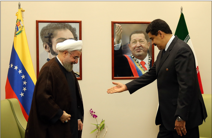
دیدار روسای جمهوری ایران و ونزوئلا