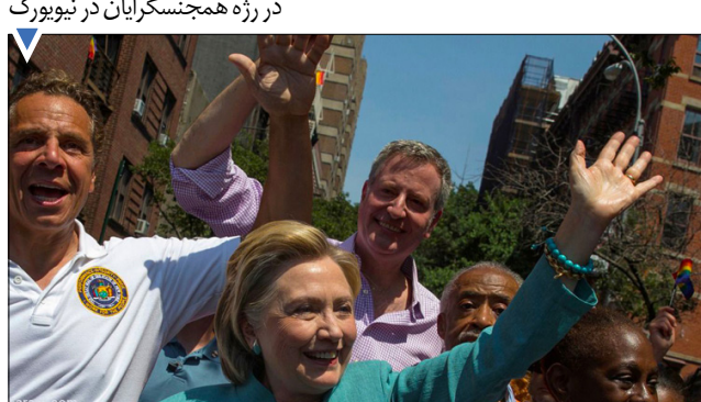
در رژه همجنسگرایان در نیویورک