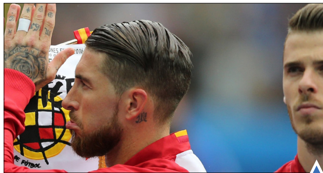
شکست اسپانیا، مدافع عنوان قهرمانی در برابر اسپانیا