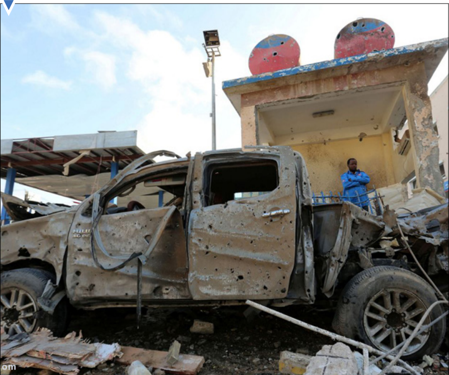
بمب‌گذاری انتحاری در پمپ بنزین در موگادیشو، سومالی