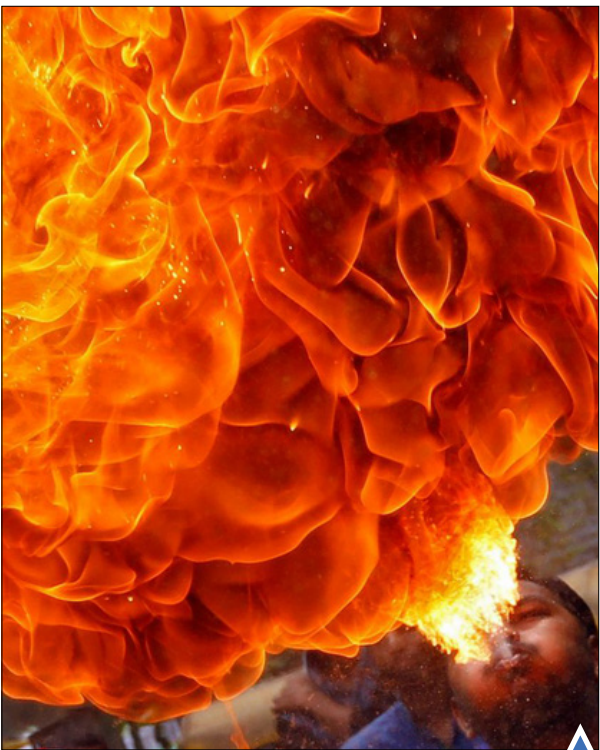
نمایش مرد هندو با آتش