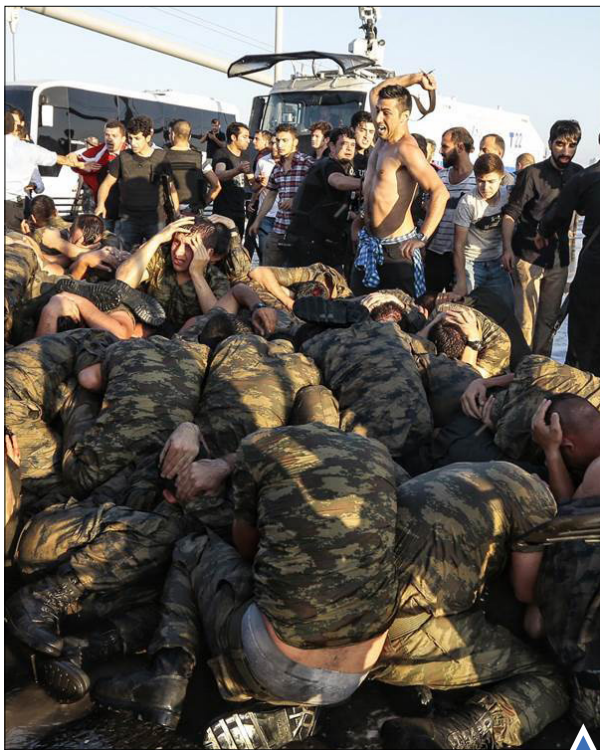
ضرب و شتم کودتاگران توسط مردم ترکیه

شب زنده داری و یادبود برای حمله تروریستی نیس در سفارت فرانسه در تایلند