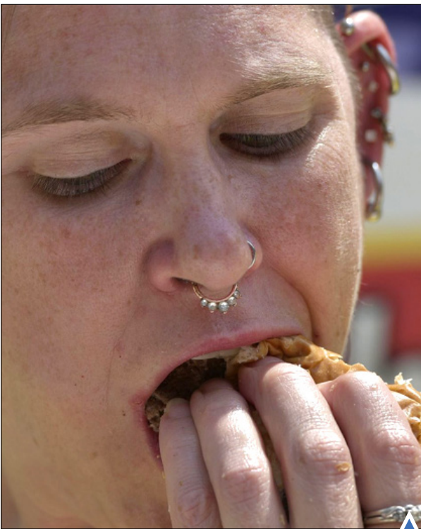
شرکت‌کننده با ظاهری خاص در مسابقه برگزینی؛ واشنگتن