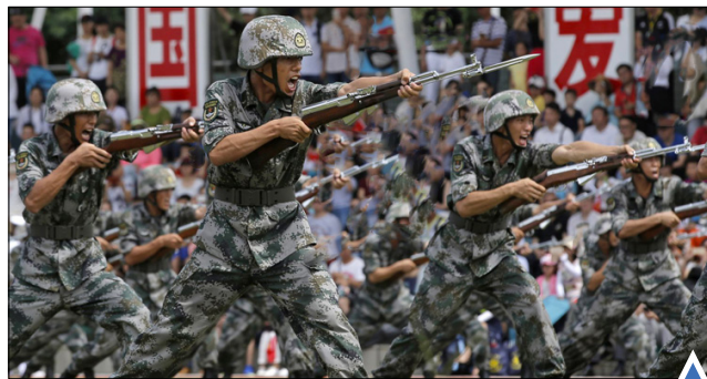
نمایش مهارت نظامی سربازان خلق چین در هنگ کنگ پس از مراسم ادای سوگند