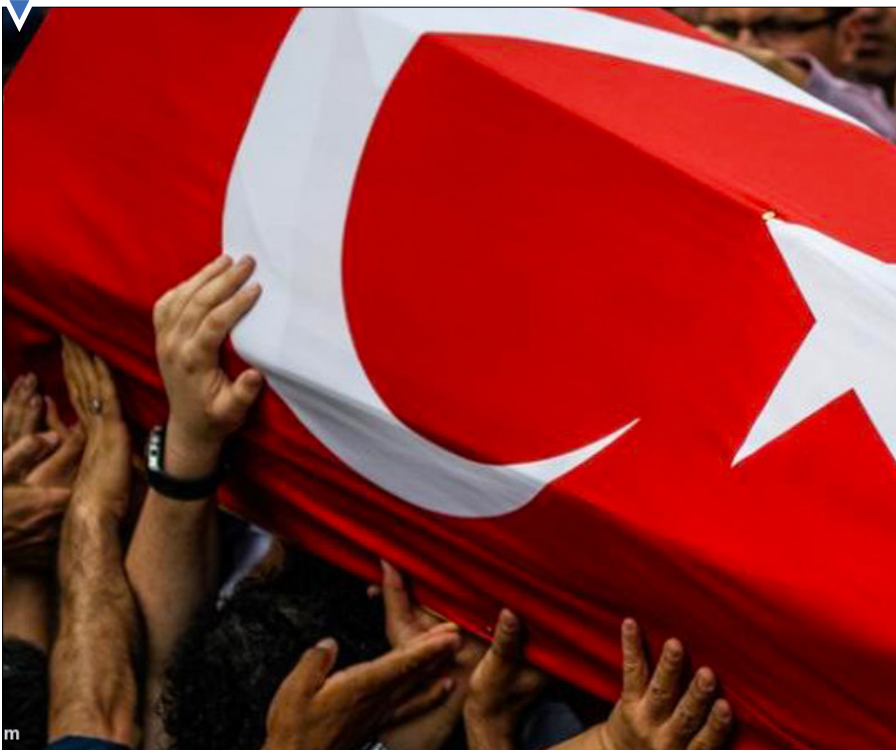
مراسم تشییع یکی از جان‌باختگان در حادثه حمله انتحاری به فرودگاه آتانورک استانبول