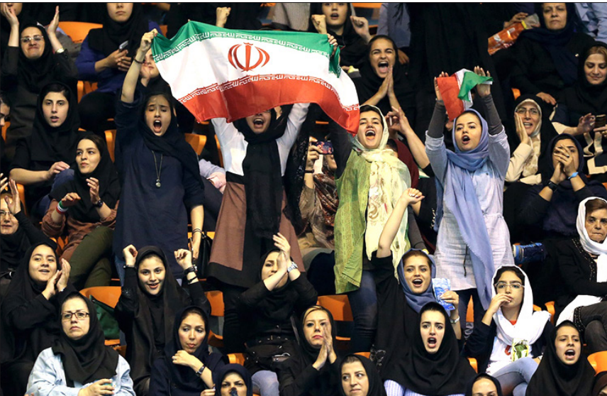
حضور بانوان در ورزشگاه در حاشیه دیدار ایران و صربستان