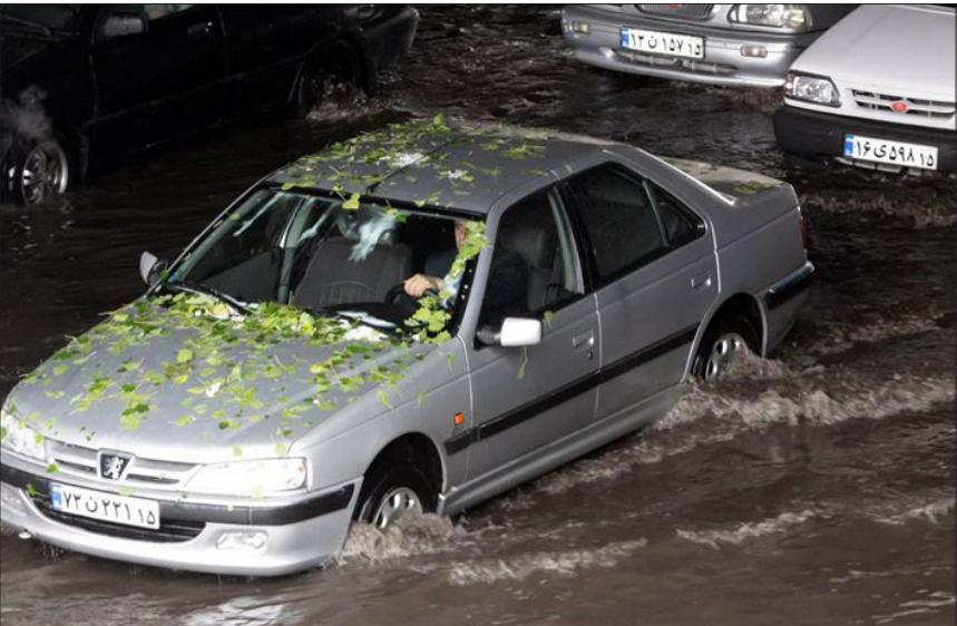
عکس روز: بارش باران شدید و تگرگ در تبریز