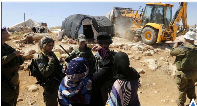
صحنه فلسطینی‌ها پس از تخریب خانه‌هایشان در نزدیکی روستای پاتا، جنوب الخلیل