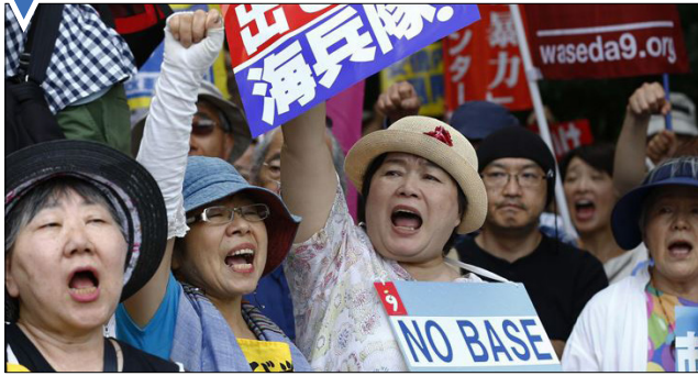
اعتراض ژاپنی‌ها به حضور پایگاه‌های نظامی آمریکا در جزیره اوکیناوا