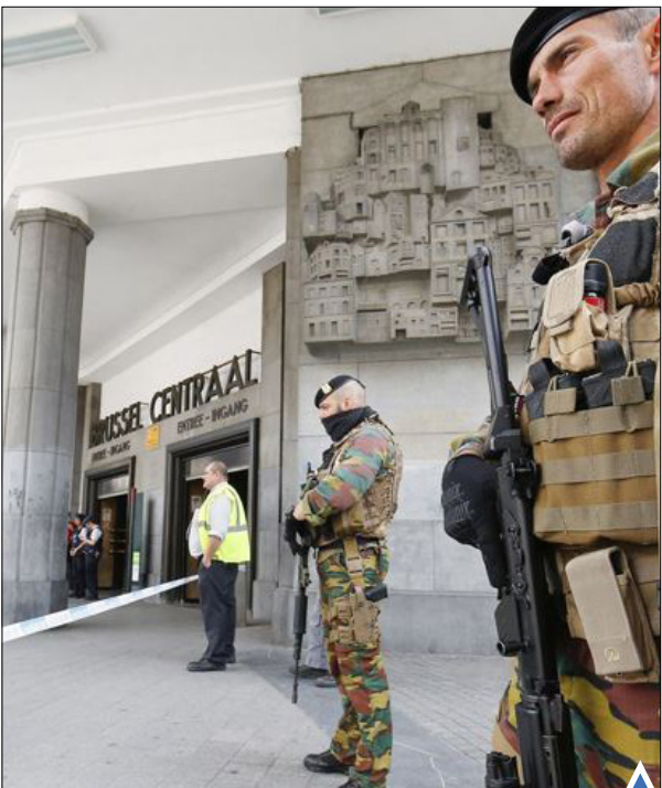
نگهبانی سربازان بلژیکی مسلح در مقابل ایستگاه مرکزی بروکسل پس از آن به دلایل امنیتی، تخلیه شد