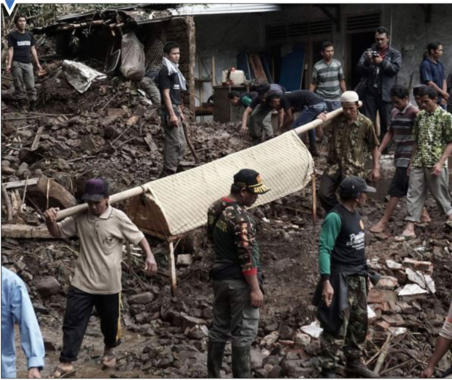
تیم جستجو و نجات به دنبال جسد قربانیان رانش زمین در اندونزی