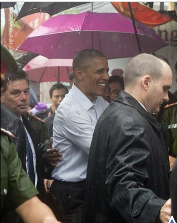
اوباما در منطقه خرید در هانوی، ویتنام