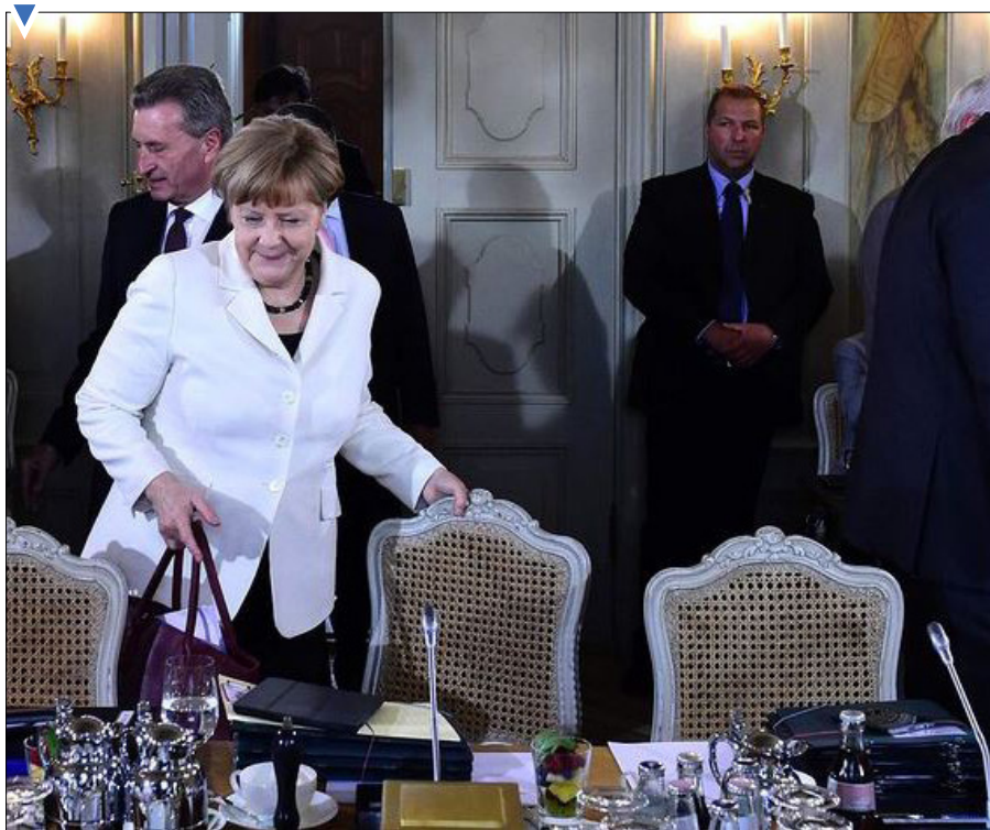
مرکل در جلسه کابینه آلمان