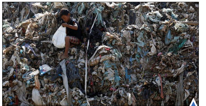
تلاش کودک کامبوجی برای پیدا کردن زباله قابل بازیافت؛ بنوم پن سخترانی اد میلیبند برای ادامه حضور انگلیس در اتحادیه اروپا