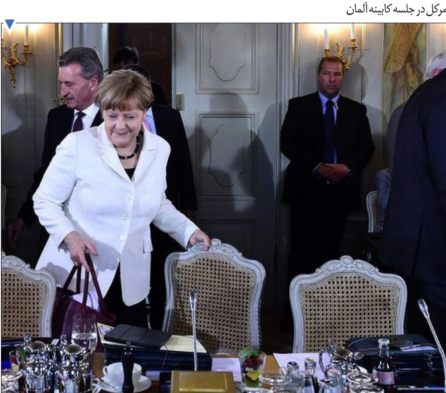
مرکل در جلسه کابینه آلمان