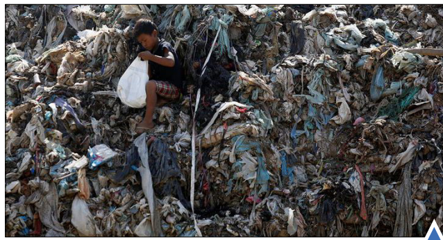
تلاش کودک کامبوجی برای پیدا کردن زباله قابل بازیافت؛ بنوم پن سنگرنانی اد میلیبند برای ادامه حضور انگلیس در اتحادیه اروپا