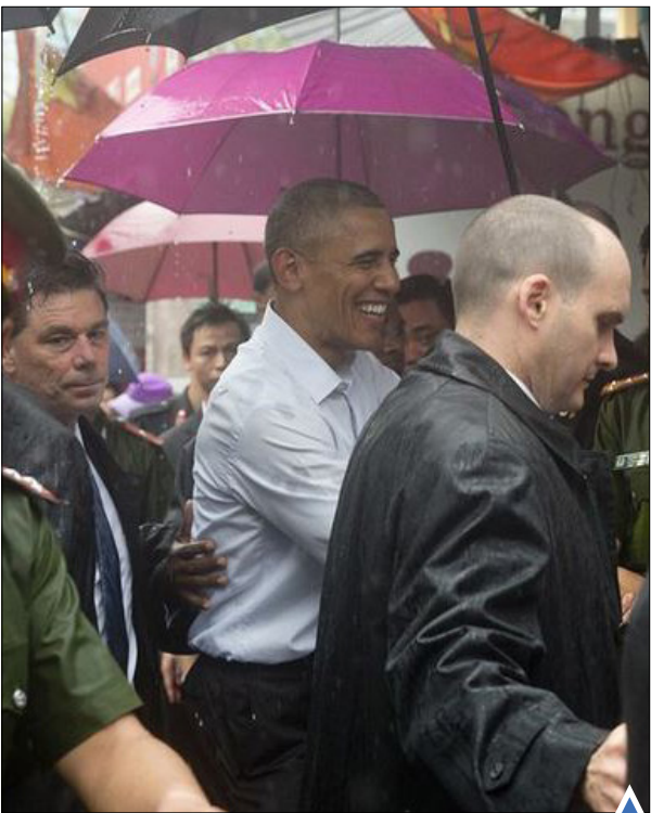
اوباما در منطقه خرید در هانوی، ویتنام