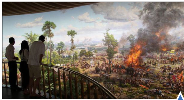
نقاشی دیواری روی دیوار موزه «پانوراما انگکور» در کامبوج