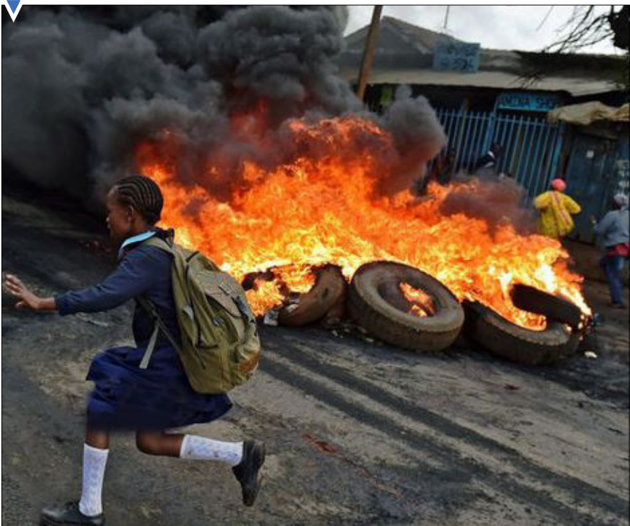
کودکی اهل کنیا از کنار آتش تظاهر کنندگان فرار می کند.