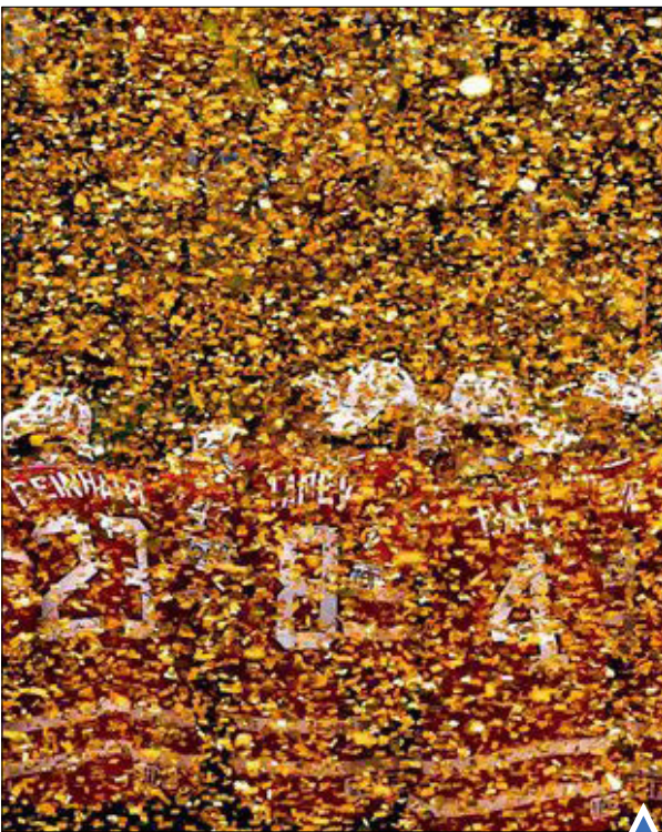
تیم هاکی روی یخ کانادا افرمان مسابقات جهانی در روسیه شد.