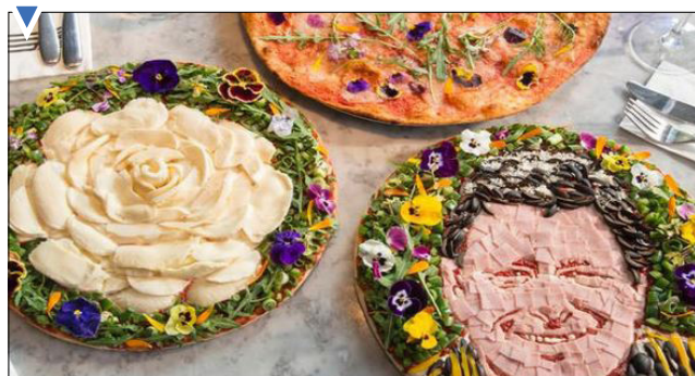
ساخت پیتزای سبزیجات همزمان با جشنواره گل و گیاه در انگلیس (wsj)