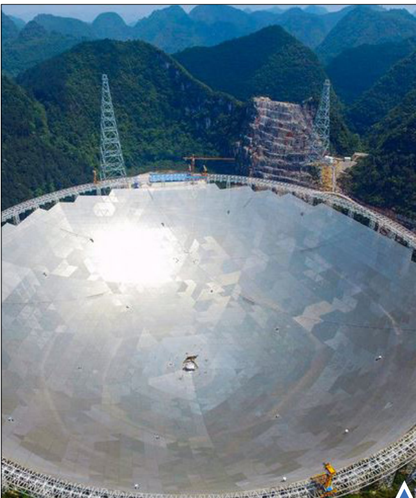
تلسکوپ رادیویی کروی دیافراگم (FAST) با اندازه ۵۰۰ متر، در یک دره کاسه‌ای شکل، گوانژو، چین

سوزاندن ببرهای تاکسیدرمی، عاچ و ... برای مقابله با قاچاق و کشتار حیوانات