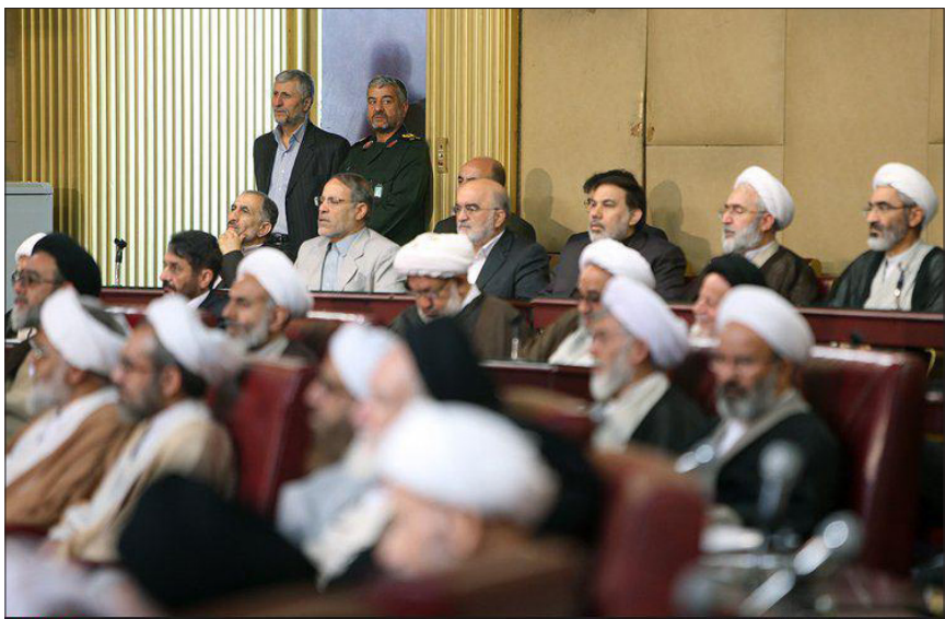
افتتاحیه پنجمین دوره مجلس خبرگان