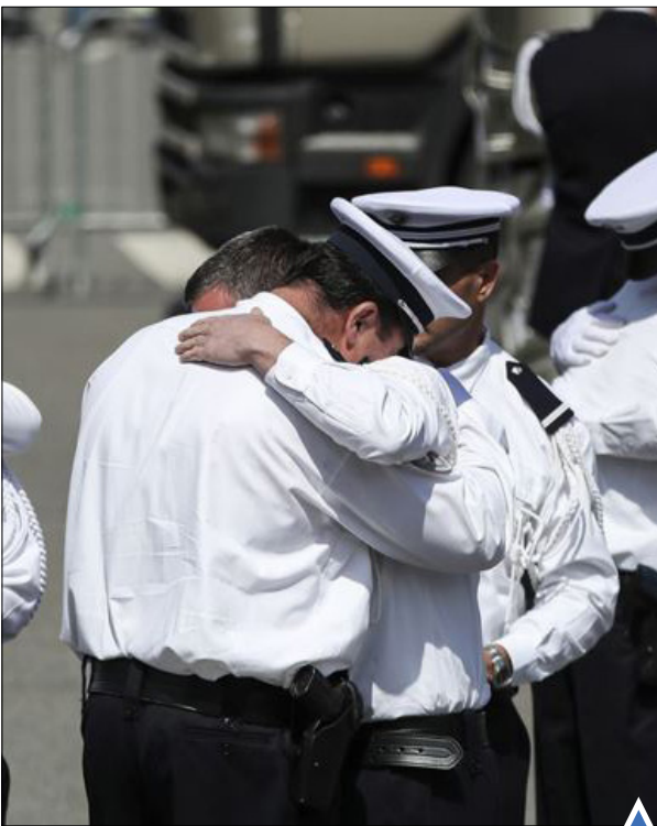
گریه برای پلیس کشته شده توسط داعش؛ فرانسه