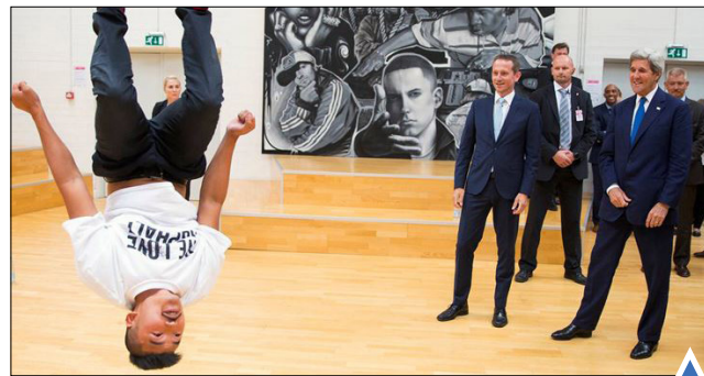
وزاری خارجه آمریکا و دانمارک در تور بازی؛ برنامه ترویج ورزش جوانان؛ کپنهاگ تلاش جوانان فلسطینی برای ورود به بیت المقدس و رفتن به مسجدالاقصی