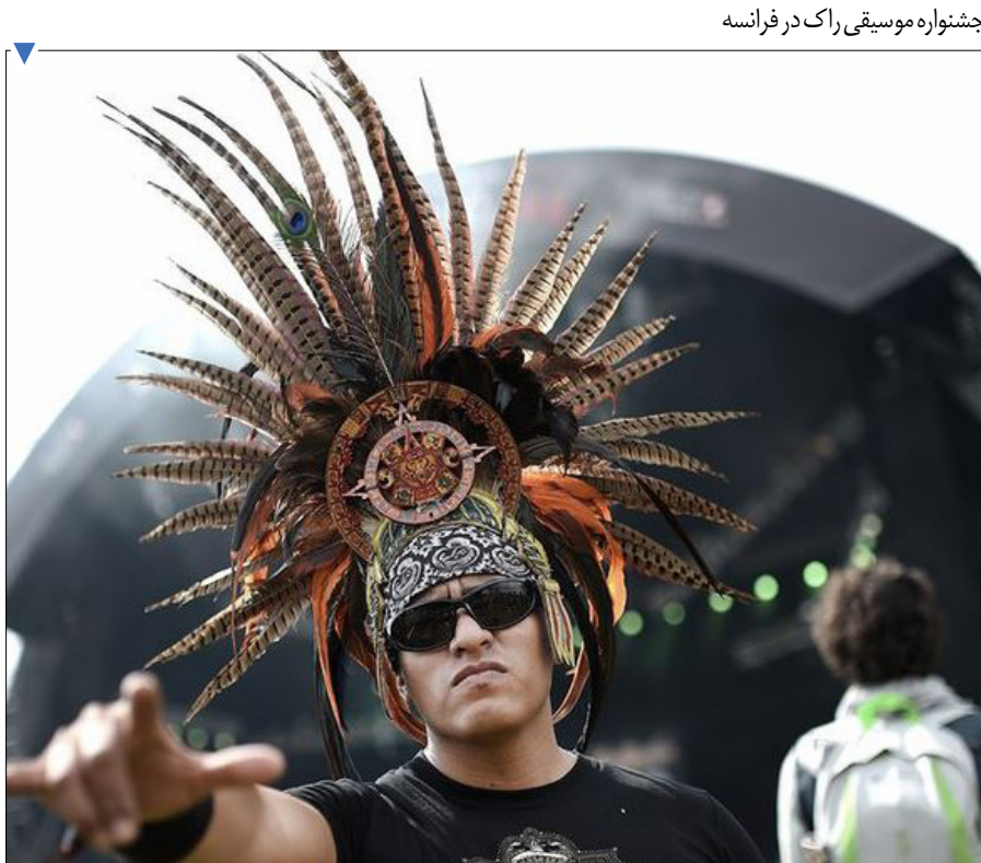
جشنواره موسیقی راک در فرانسه