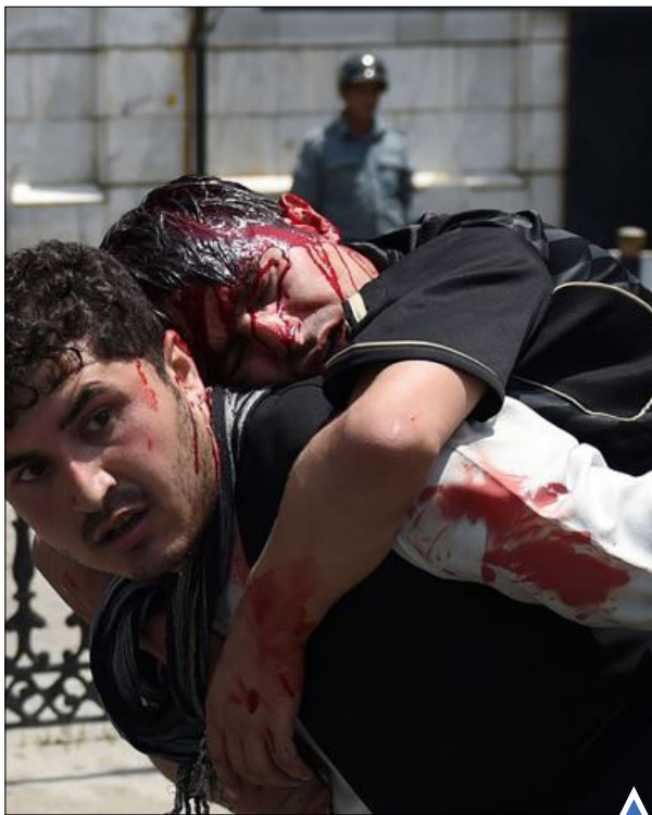
زخمی شدن معترض به خشونت طالبان پس از درگیری با پلیس افغانستان