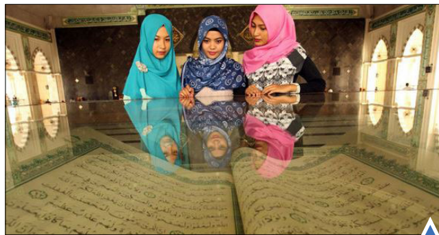
بازدید از نسخه بزرگ قرآن در مسجدی در «ماساکر» اندونزی