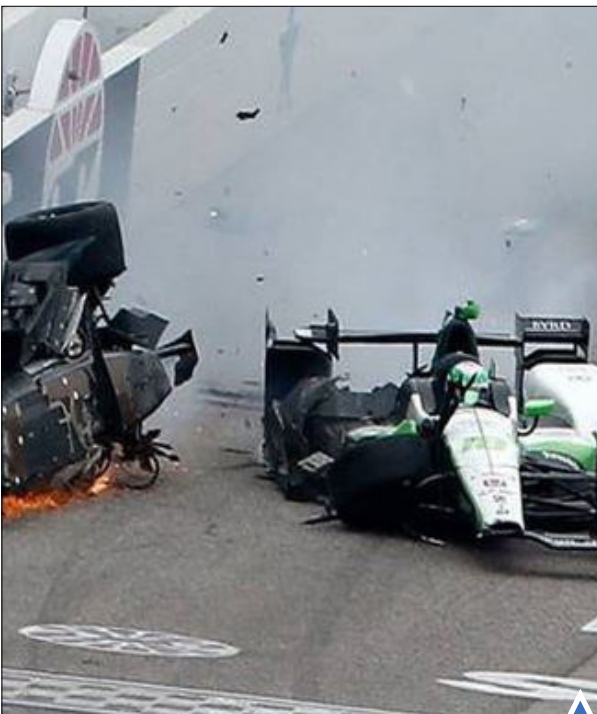
تصادف شدید در مسابقه اتومبیل رانی ایالت تگزاس آمریکا

یک متخصص بمب محتویات ساک را نزدیک محل انفجار بمب در شانگهای چین بررسی می‌کند.