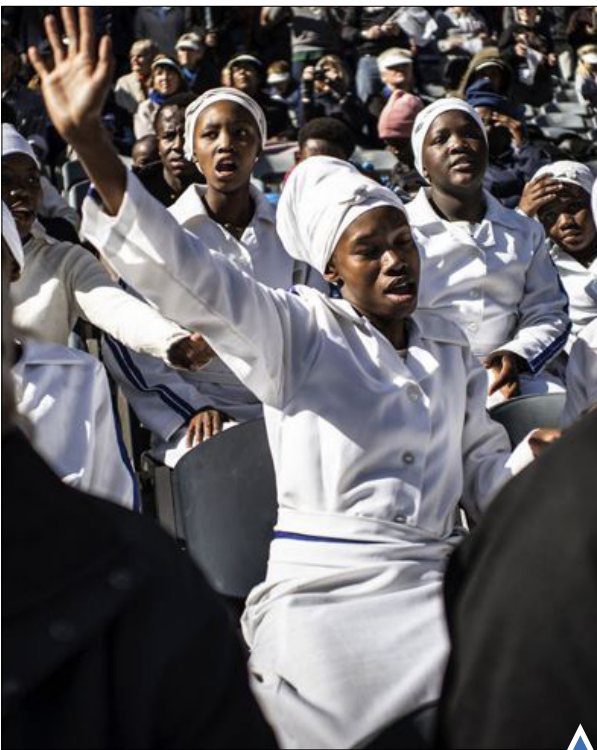
اعضای کلیسا در مراسم سالگرد قیام سووتو در ژوهانسبورگ؛ آفریقای جنوبی

دستگیری یکی از معترضان به حقوق دگر باشان در ستول؛ کره جنوبی