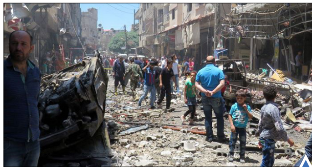
محل انفجار بمب در دمشق؛ سوریه

یکی از هواداران تیم فوتبال انگلیس قوطی گاز اشک‌آوری که پلیس ماریسی پرتاب کرده را دور می‌کند