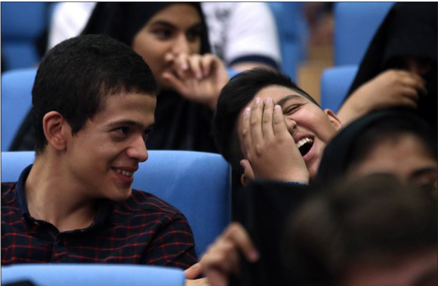
عکس روز / خنده‌های