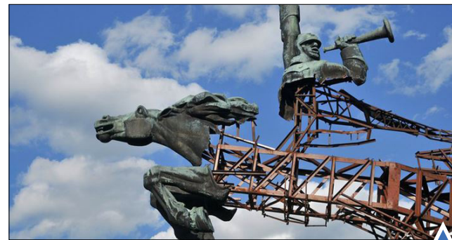
بقایای مجسمه باقی مانده از اتحاد جماهیر شوروی؛ کیف، اوکراین