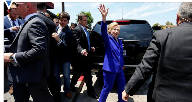
واکنش هیلاری کلینتون به هوادارانش؛ لس آنجلس