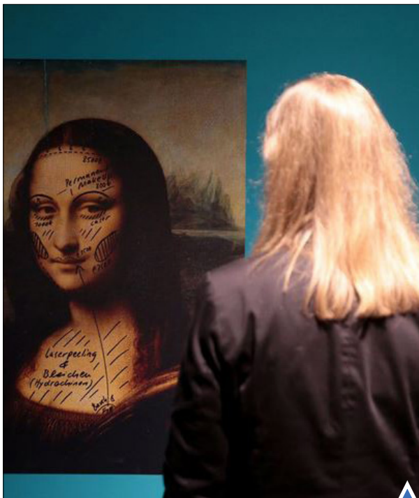
دو تصویر از مونالیزا با پیشنهادات جراحی پلاستیک؛ نمایشگاهی موزه، بن، آلمان