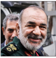
سردار حسین سلامی

سردار حسین سلامی با بیان اینکه کسی نمی‌تواند به جمهوری اسلامی چپ‌نگاه کند ، گفت: ایران اسلامی امروز در اوج اقتدار و قدرت بازآ زندگی قرار دارد. سلامی که در مراسم یادبود شهدای مدافع حرم مازندران ی شرکت کرده بود با یادآوری رشادت‌های