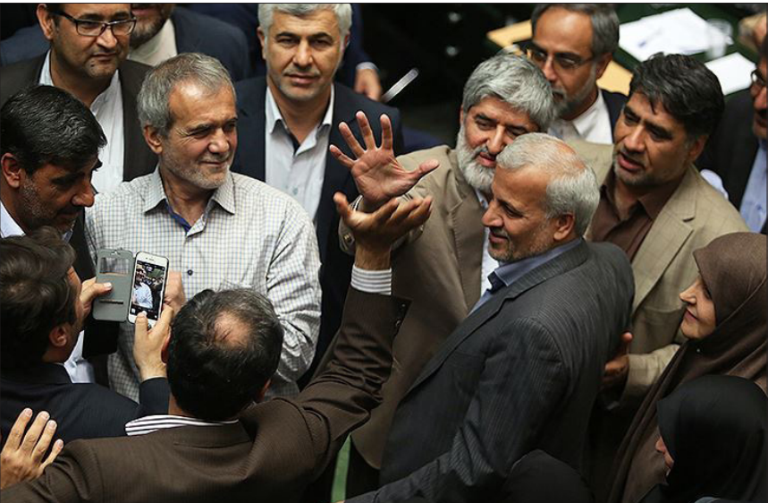
عکس روز /در حاشیه