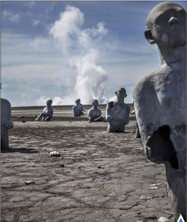
چیدمان مجسمه‌های بازمانده برای نمایش زندگی قربانیان سیل ده سال پیش در اندونزی

بازگرداندن جسد مهاجران غرق شده به ایتالیا؛ بیش از ۷۰۰ مهاجر در روزهای اخیر در دریای مدیترانه غرق شده‌اند.