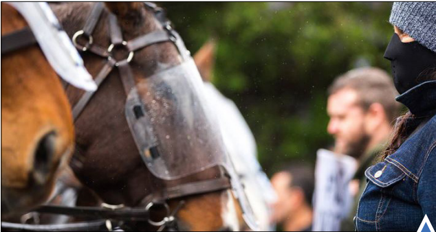
اعضای گروه ضد فاشیسم مقابل پلیس؛ زن ۱۲۰ ساله روسی در آستاراخان؛ استرالیا پیرترین فرد روسیه