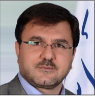
محمد علی وکیلی

فضایی که اکنون در مجلس وجود دارد به‌ویژه در خصوص بحث فراکسیون‌ها که حتما اصلاح‌طلبان اصولگرایاننده‌نظر سخت‌می‌آید زیربسیاری از نماینده‌ها مشی اعتدالی یا میانه روی دارند، نه خود را وابسته به اصولگرایی و نه وابسته به اصلاح طلبی می‌دانند به گفته نعمتی طیف رهروان و اصولگرایان معتدل و همچنین مستقلمین ممکن است یک فراکسیون جدید را تشکیل دهند و لیست امید هم در همان فاز اصلاحات ممکن است فراکسیون دیگری را شکل دهد اما معتمد غیر از اینها فراکسیون سومی هم ایجاد خواهد شد.