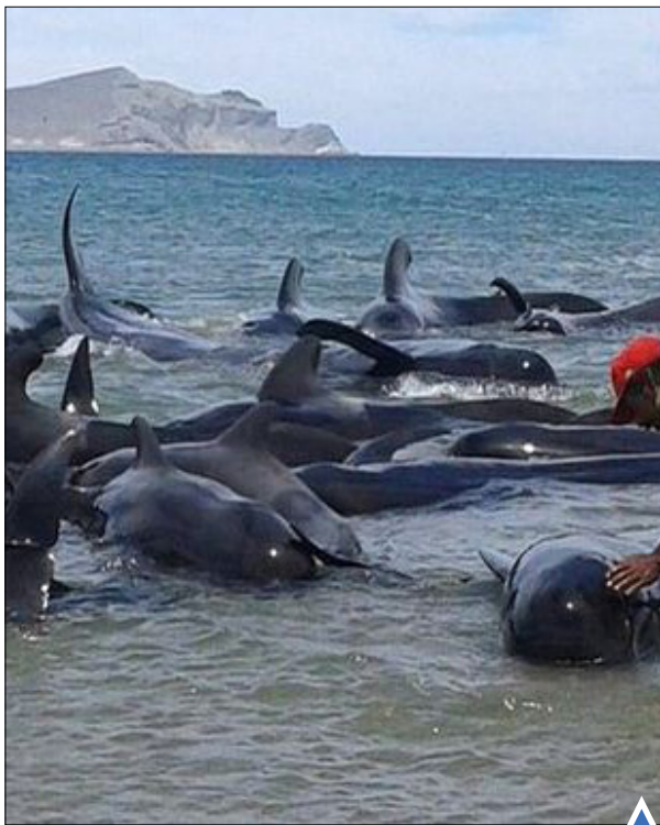
بسیست وهفت نهنگ در ساحل مکزیک گرفتار شدند.