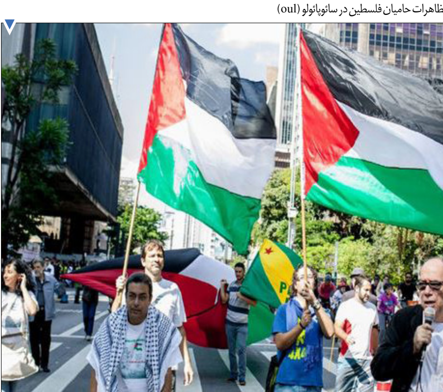
تظاهرات حامیان فلسطین در سائوپائولو (ou)