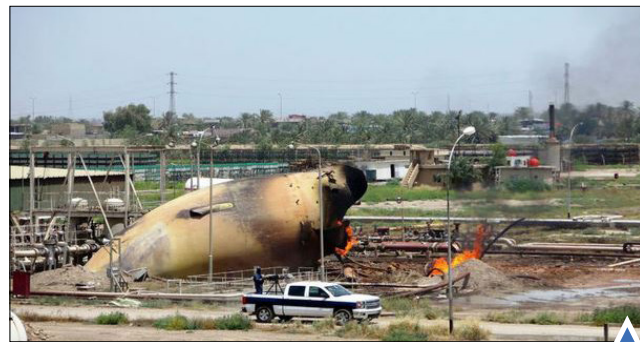
حمله تروریست‌ها به نیروگاه گازی عراق (GETTY) تانک روسی در یک رویداد آموزش نظامی در شمال سنت پترزبورگ (GETTY)