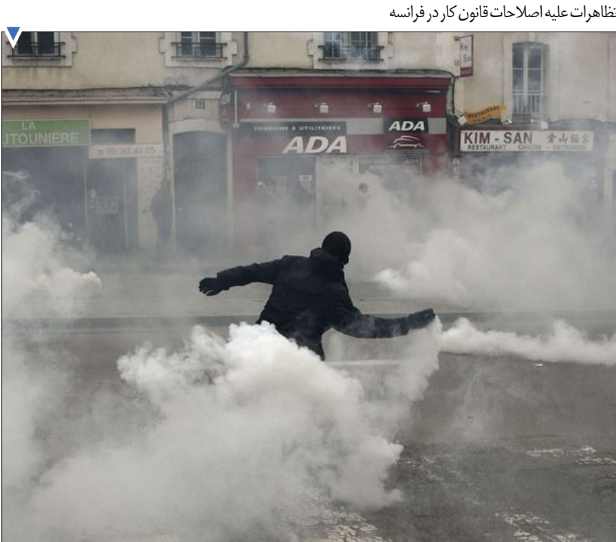
تظاهرات علیه اصلاحات قانون کار در فرانسه