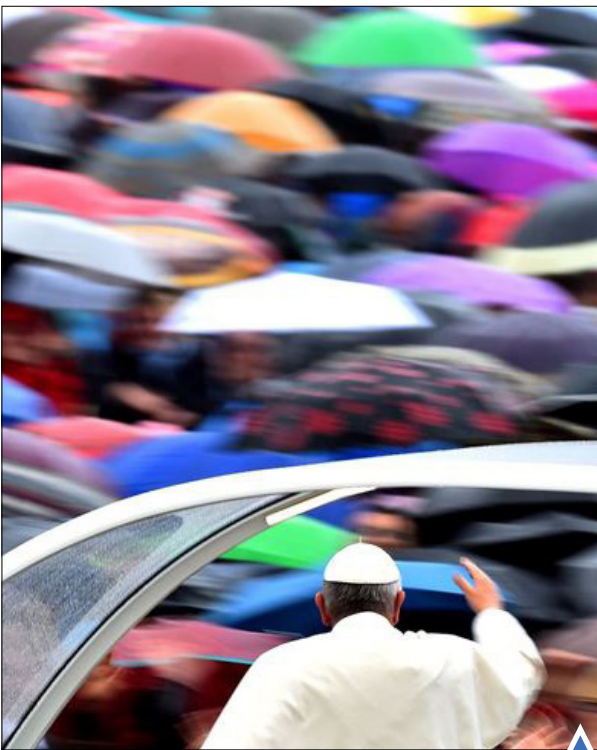
پاپ فرانسیس در میدان سنت پیترو واتیکان