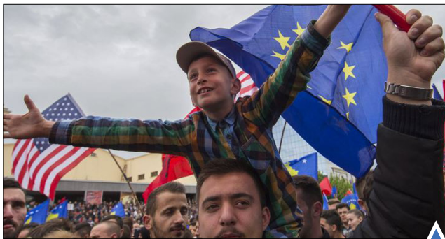
تظاهرات حامیان احزاب سیاسی