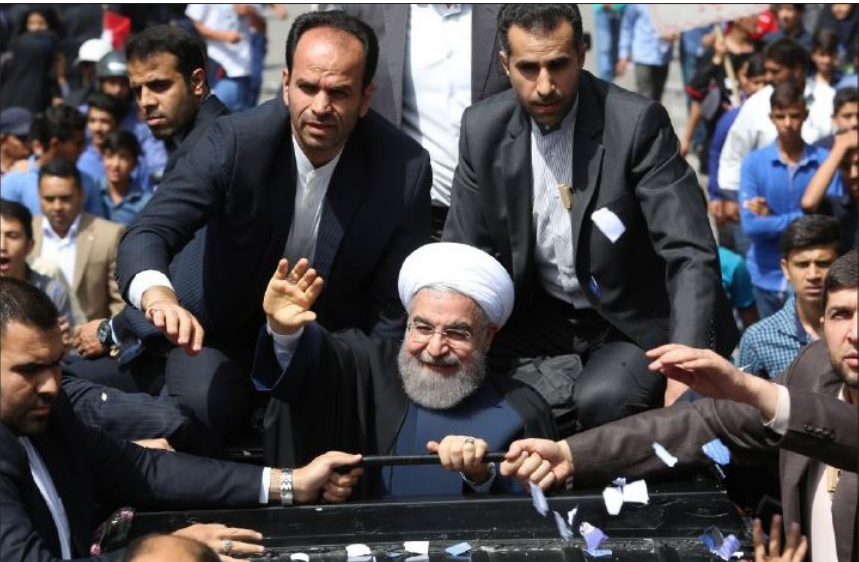
در حاشیه سفر رئیس جمهوری به کرمان