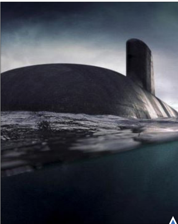
فرانسه برنده مناقصه ساخت ۱۲ زیر دریایی برای استرالیا شد. (DCNS)

آتش زدن عاچ‌های فیل برای جلوگیری از قاچاق غیرقانونی در کنیا (AP)