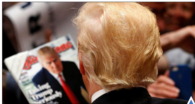
ترامپ در کمپین انتخاباتی کوستا مسا، کالیفرنیا