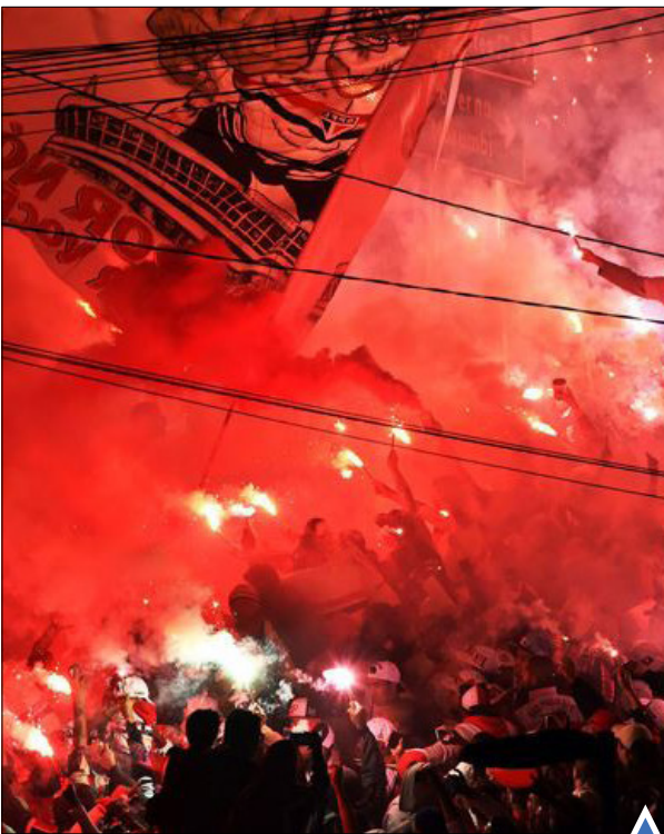
حامیان تیم سانویاتولو در مسابقه برابر تیم تولوکای مکزیک