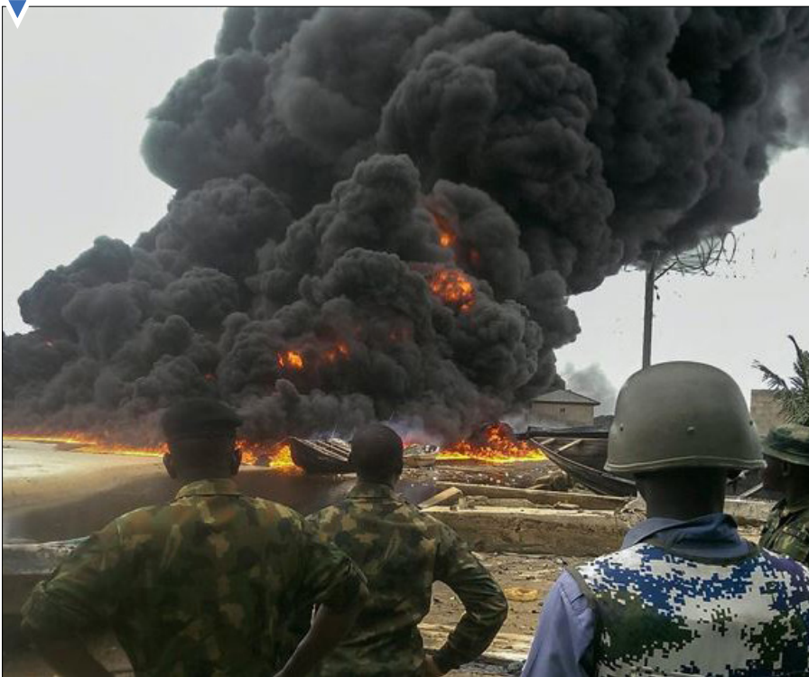
نابود کردن تصفیه خانه غیرقانونی در نیجریه