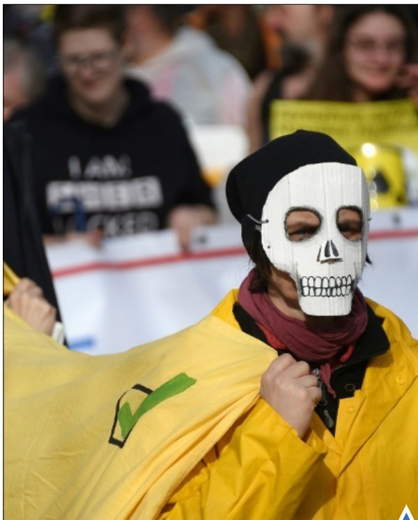
اعتراض فعالان ضد هسته‌ای در مراسم بزرگداشت فاجعه فوکوشیما