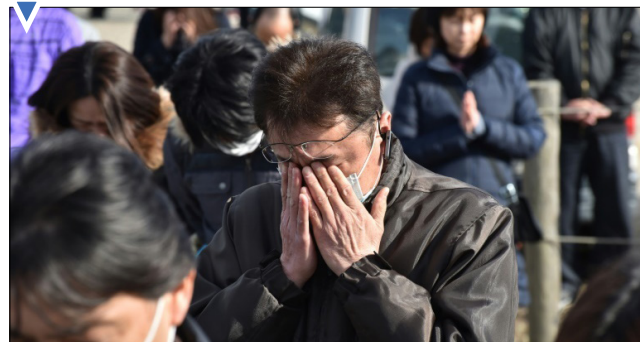
یک دقیقه سکوت در سالگرد سونامی در ژاپن