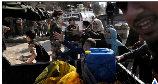
توزیع مواد غذایی بین مردم در موصل