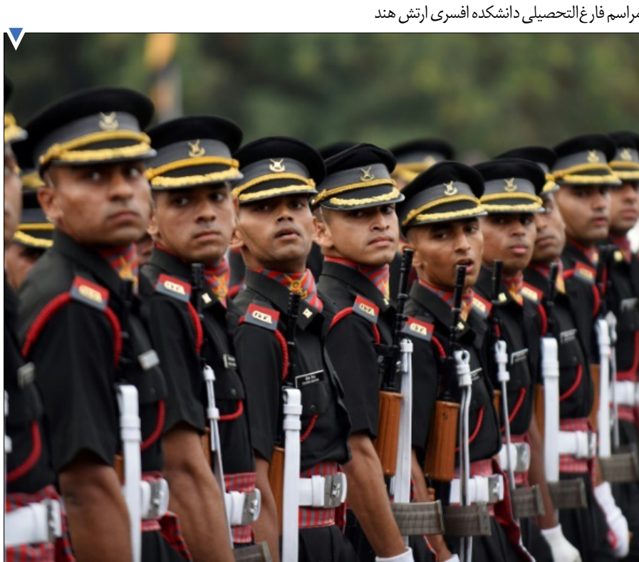
مراسم فارغ التحصیلی دانشکده افسری ارتش هند