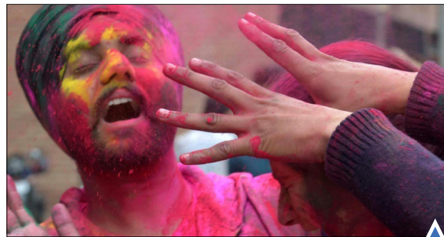
فستیوال رنگ‌ها در امریتسار هند