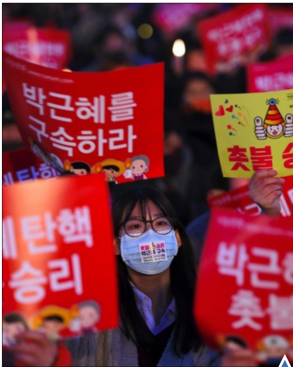
حواشی برکناری رئیس جمهور کره جنوبی