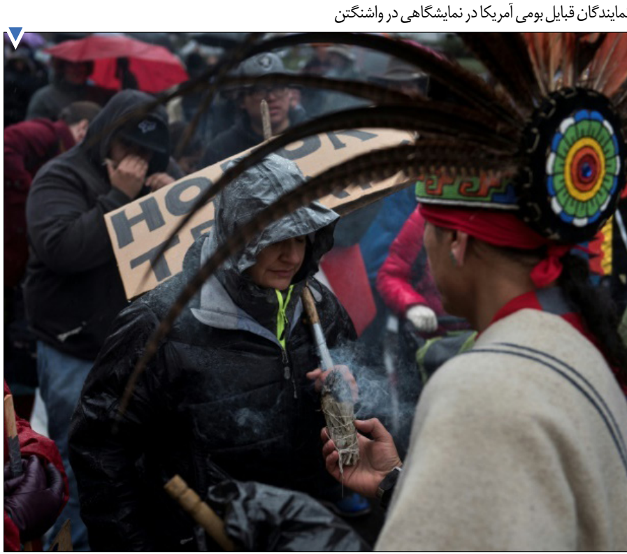
نمایندگان قبایل بومی آمریکا در نمایشگاهی در واشنگتن