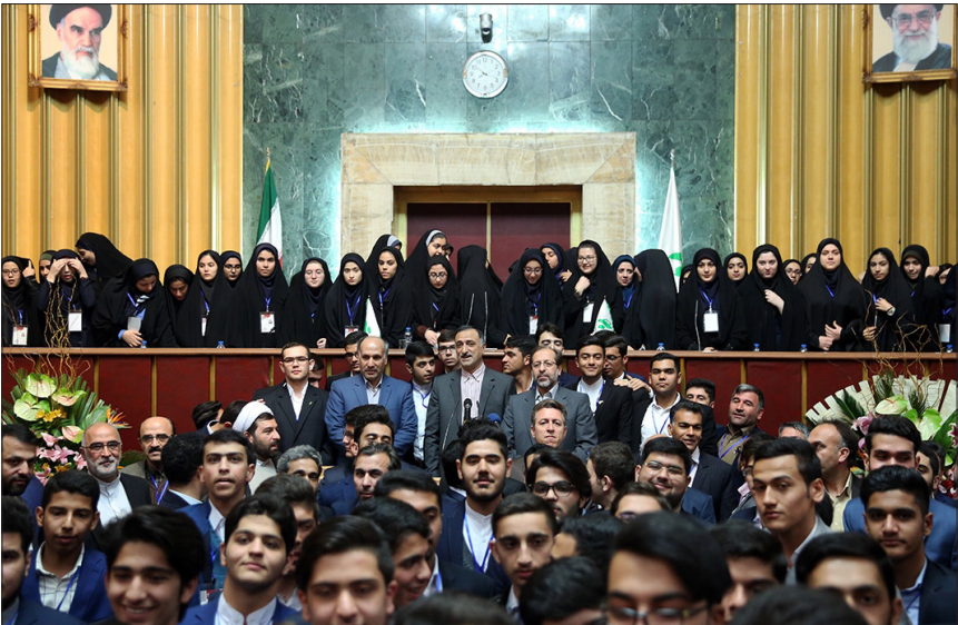
هشتمین دوره مجلس دانش آموزی

عنوان داشت: باید از خودشان بپرسید که چه پاسی دریافت کرده‌اند که داوطلب شدند اما از سوی شورای نگهبان هیچگونه پاس و خبری ارسال نشده و اعلام نظر شورای نگهبان در مهلت بررسی صلاحیت‌ها اعلام خواهد شد.