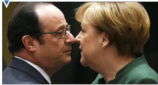
مرکل و اولاند در دیدار رهبران اتحادیه اروپا در بروکسل