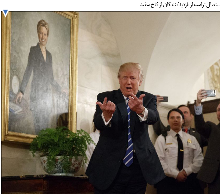
استقبال ترامپ از بازدیدکنندگان از کاخ سفید