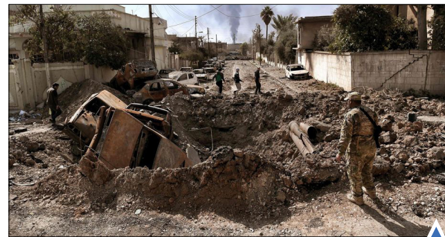
حمله هوایی در موصل مقابل دریای طوفانی؛ نیس، فرانسه