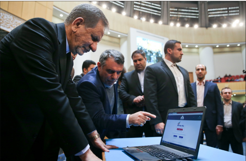
رونمایی از سامانه