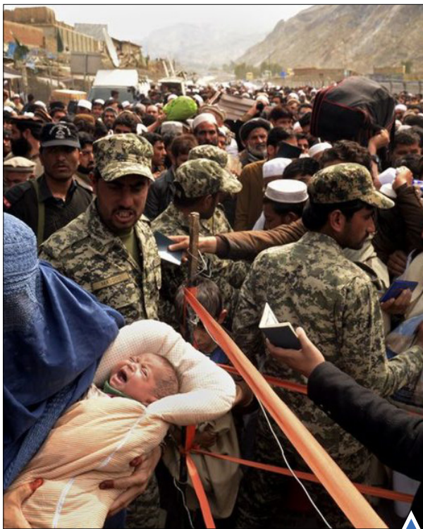
عبور از مرز افغانستان