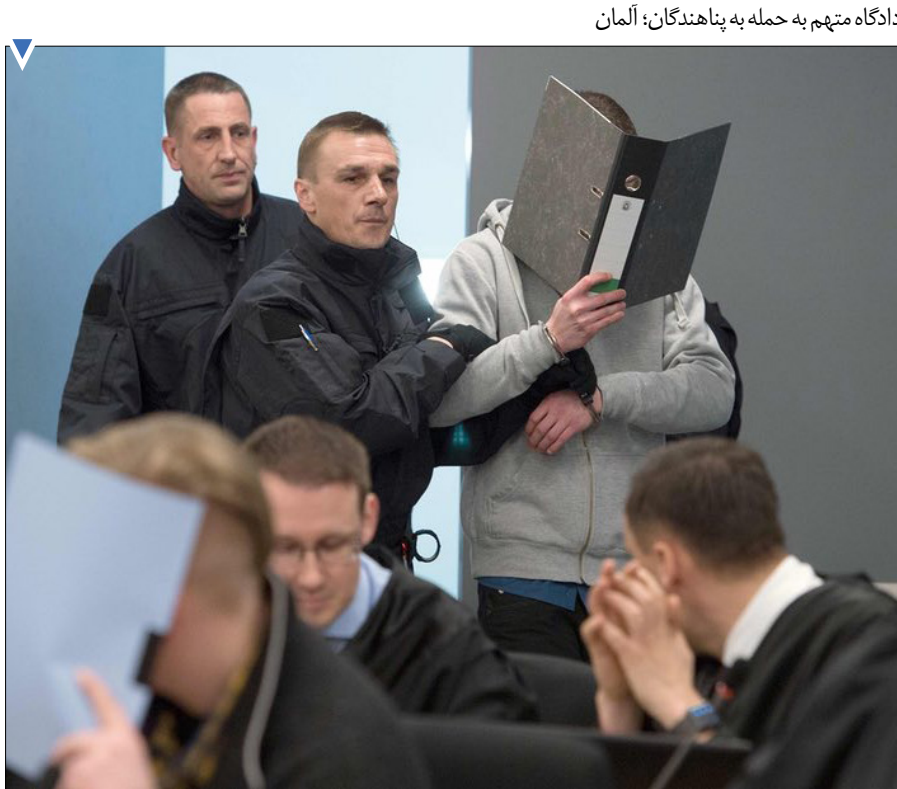
دادگاه متهم به پناهندگان؛ آلمان