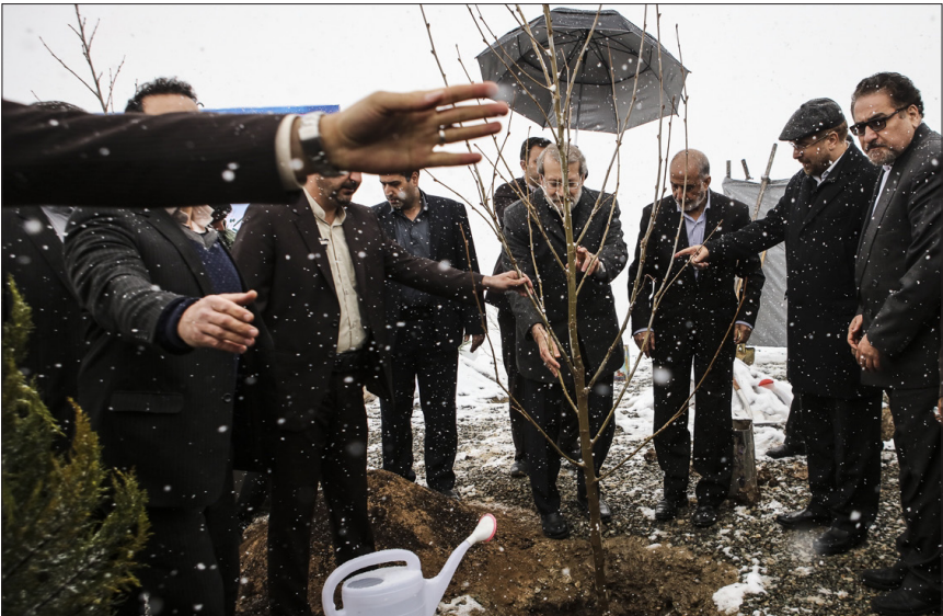
غرس نهال توسط رییس مجلس شورای اسلامی

نامہ‌نویز نوشت: عیان شدن اختلاف بین لاریجانی و چمنای لاریجانی در این سال‌ها نماد اعتدال در جریان اصول‌گرایی بوده است و این رفتار مورد تأیید بزرگان نظام از جمله مراجع تقلید بوده است. اوسعی کرده است در برابر طیف تندرو اصول‌گرا بایستد و همین امر باعث شده است مورد حمله طیف تندرو اصول‌گرا قرار بگیرد.