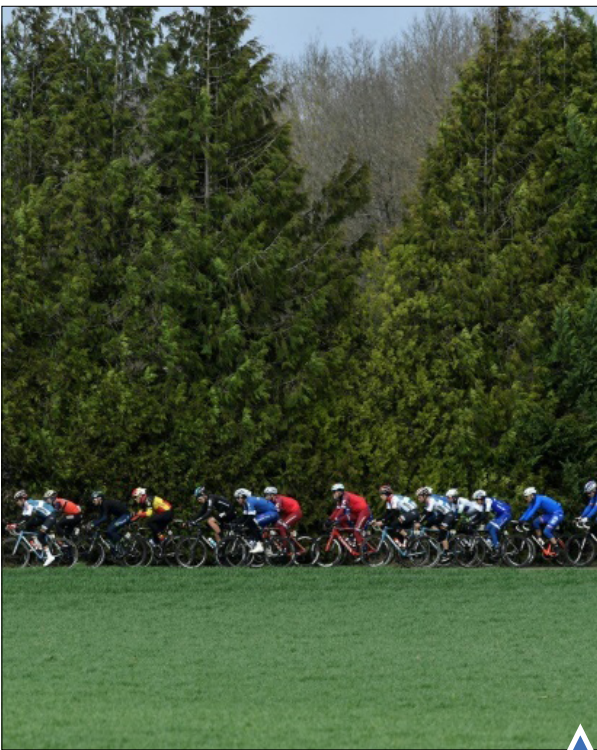
مسابقه دوچرخه‌سواری در فرانسه