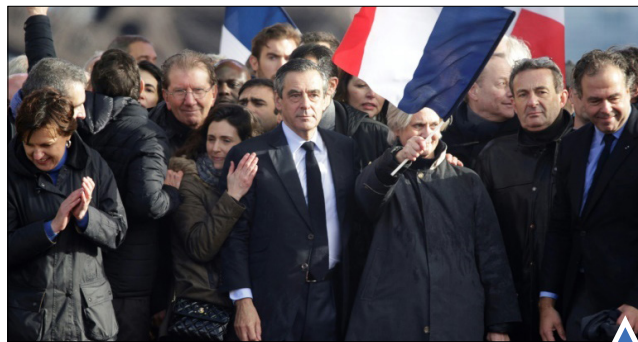
حامیان فرانسوا افیون