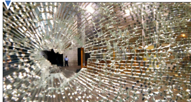
شیشه شکسته بعد از تیراندازی مرگبار در لیما