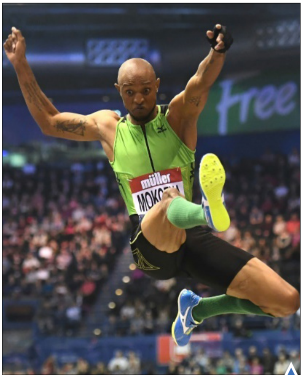
ورزشکاری از آفریقای جنوبی در مسابقه پرش؛ بیرمنگام