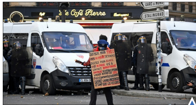
تظاهرات علیه خشونت پلیس در پاریس