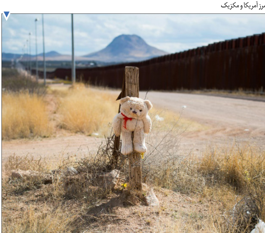
مرز آمریکا و مکزیک