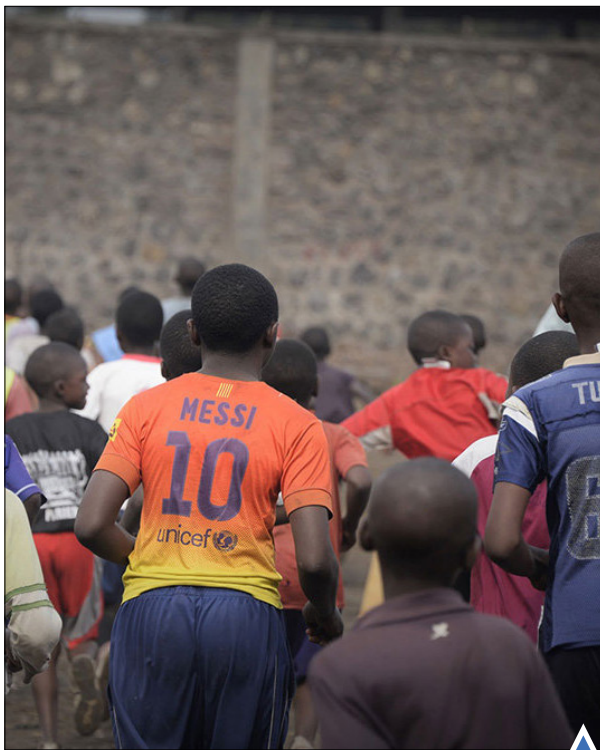
قدرت اتحاد بخش فوتبال در کنگو