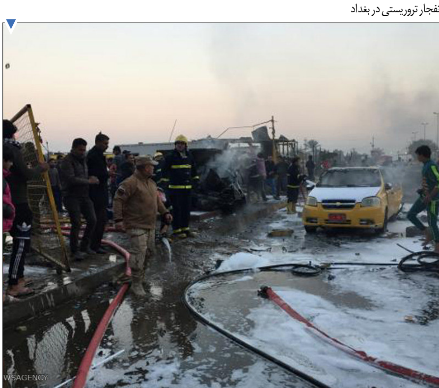
انفجار تروریستی در بغداد