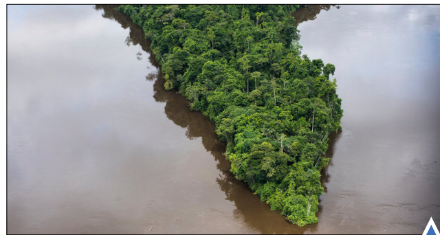
جنگل‌های ایالت شمالی آمایا برزیل در خطر انقراض