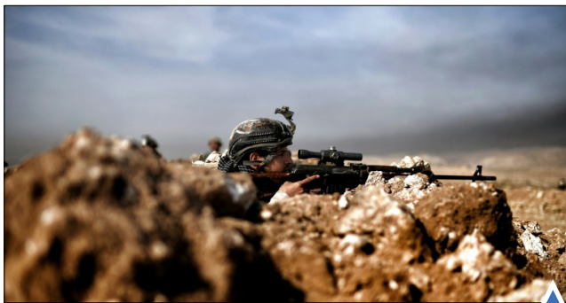
نیروی ارتش عراق