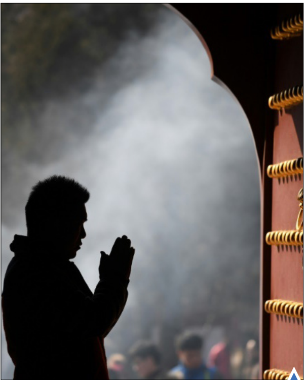
دعا در معبد؛ پکن