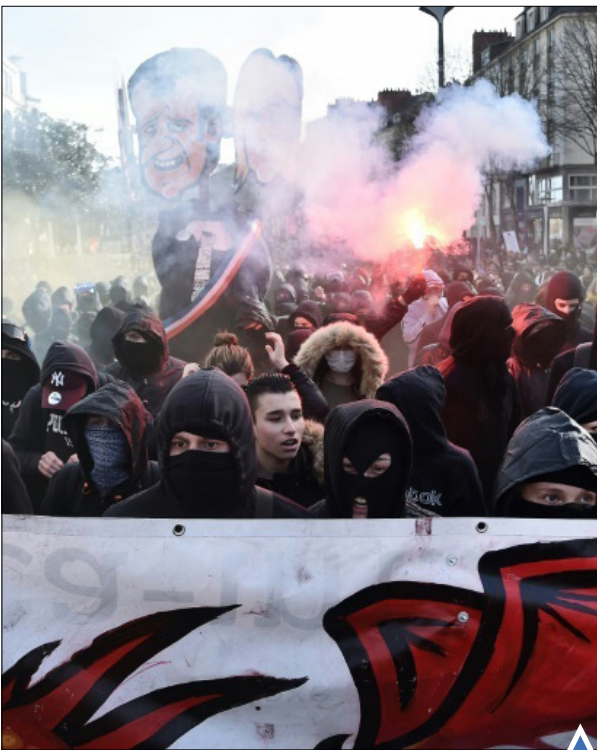
تظاهرات علیه نامزدهای مخالفان ریاست جمهوری در فرانسه