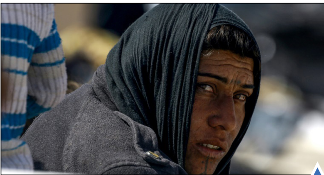
اردوگاه عراقیان آواره