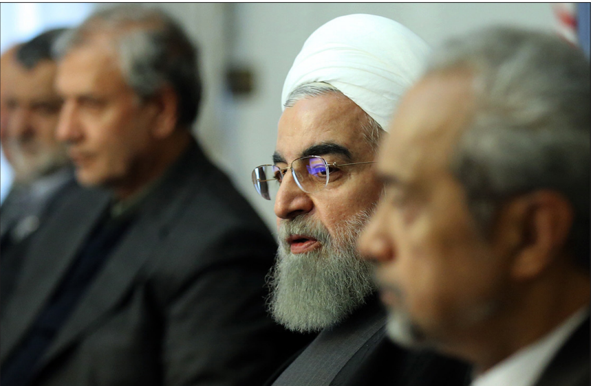
جلسه شورای عالی