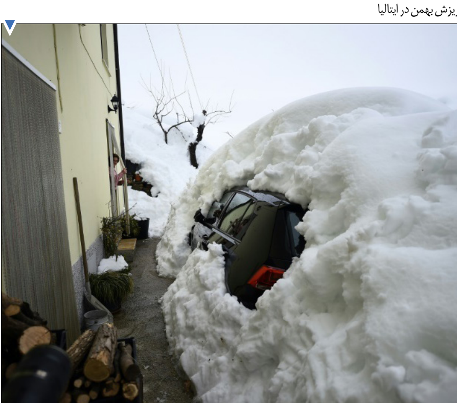
ریزش بهمن در ایتالیا