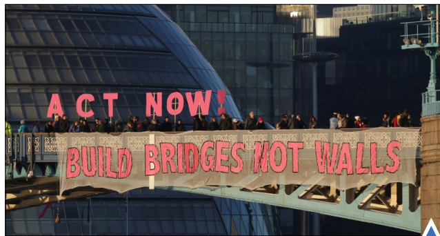
شعار علیه ترامپ