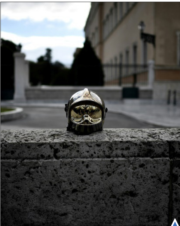
تظاهرات علیه ریاضت اقتصادی در آتن