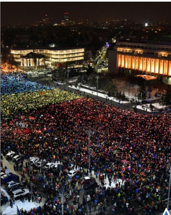
تظاهرات علیه دولت رومانی