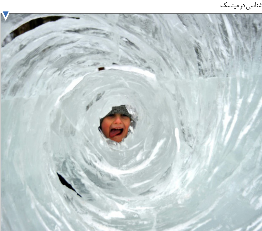
شناسی در مینسک