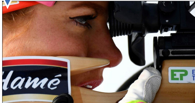
مجسمه یخی در نمایشگاهی در باغ گیاه