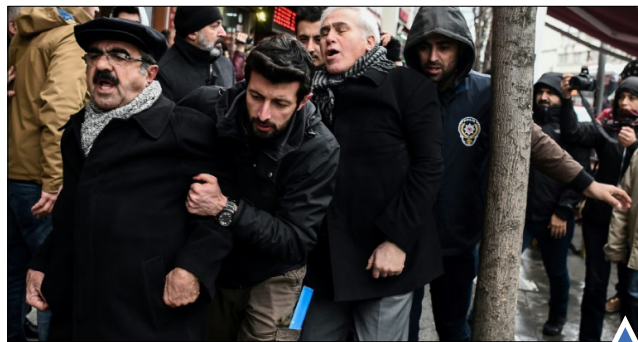
پلیس ترکیه تظاهرکنندگان در استانبول را دستگیر می‌کند