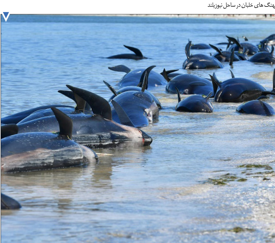
پهنگ های خلیان در ساحل نیوزیلند