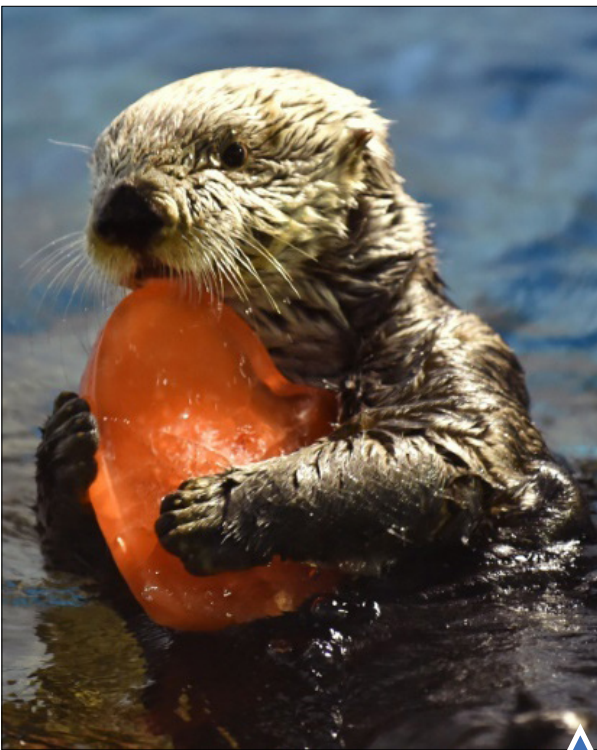
سمور در پارک تفریحی در یوکوهاما