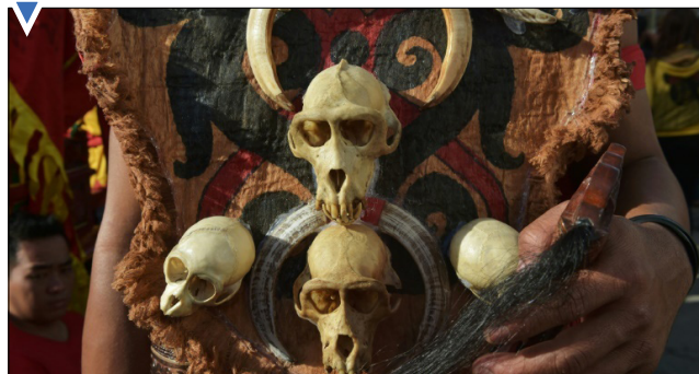
رژه پایان جشن سال نوی چینی در اندونزی