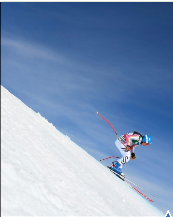
مسابقه اسکی آلپاین در سنت موریتز