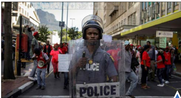
پلیس ضدشورش در جریان اعتراض در آفریقای جنوبی