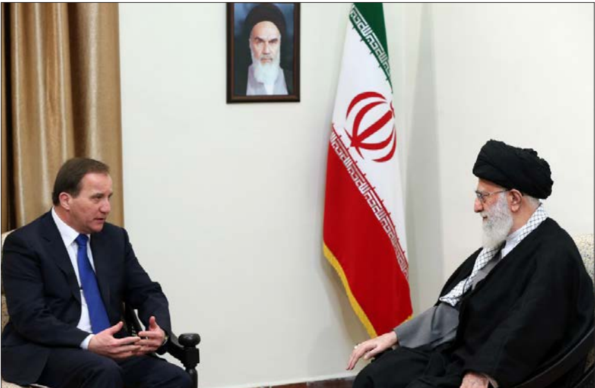
دیدار نخست وزیر سوئد با رهبر معظم انقلاب

رویداد ۲۴ نوشت: رابطه مستقیم خیانت و تحریم مشارکت با «آمدنیوز» و دیگر نوچه‌های اپوزسیون آمدنیوزها، نه موافق پیشنهاد سید محمد خاتمی برای «آشتی ملی» هستند و نه موافق توصیه او برای حضور مردم در راهپیمایی ۲۲ بهمن؛ چرا که با اصل نظام و آرمان‌های اولیه آن، مخالف هستند و راه پیشبرد اهداف شوم خود را نیز تأکید بر «تفرق» میان مردم و دلسردی آنان از انقلاب اسلامی تعیین نموده‌اند.