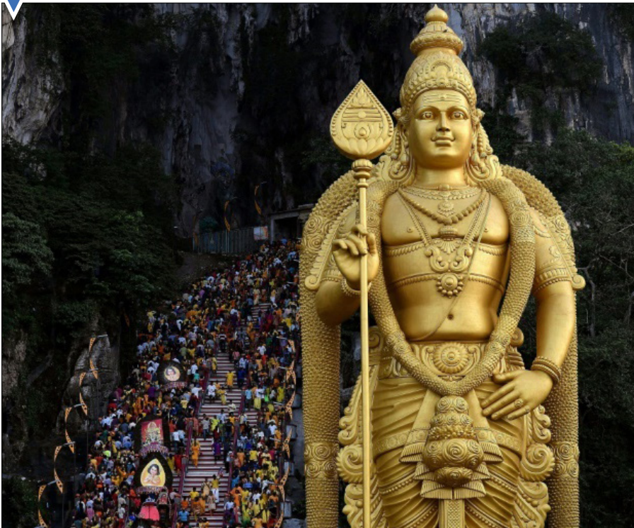
جشنواره تاییوسام در کوالالامپور