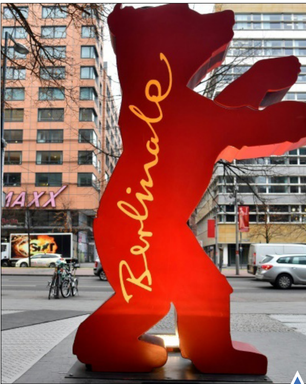
در آستانه جشنواره برلین