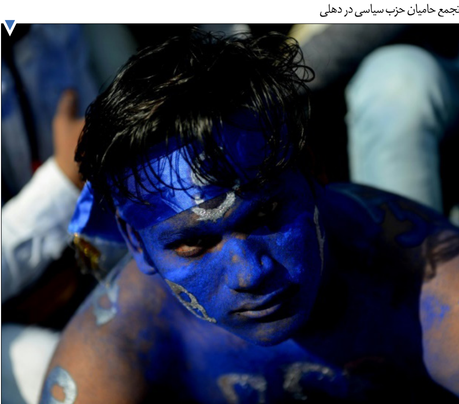
تجمع حامیان حزب سیاسی در دهلی