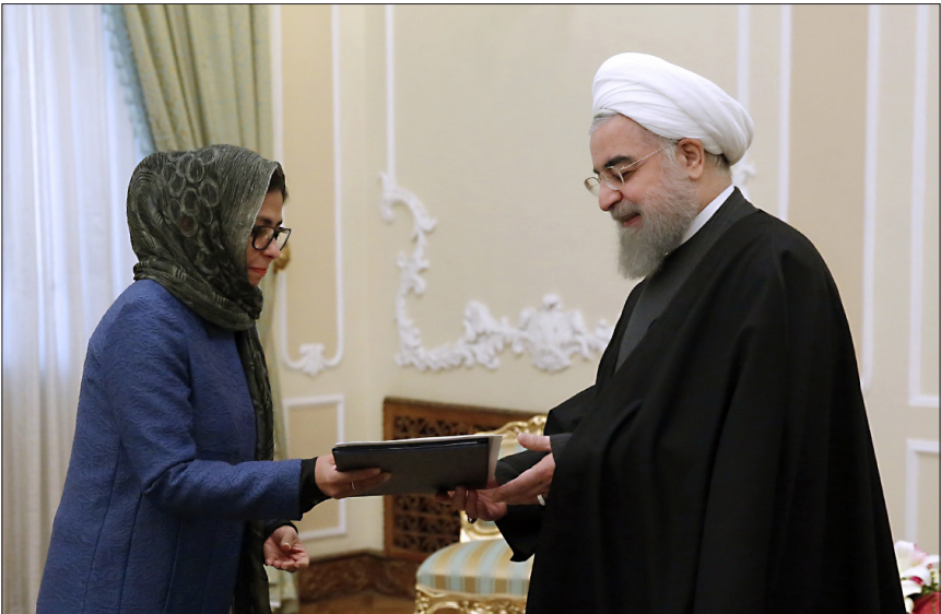
دیدار وزیران امور خارجه