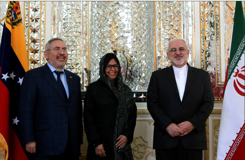
دیدار وزیران خارجه ایران و ونزولا