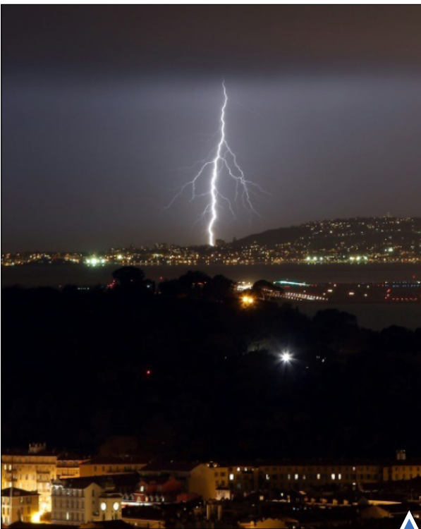
رعد و برقی در نیس