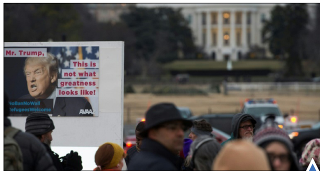
مخالفان فرمان ترامپ در واشنگتن