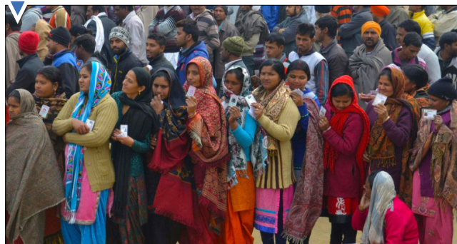
صف رأی در انتخابات محلی در پنجاب