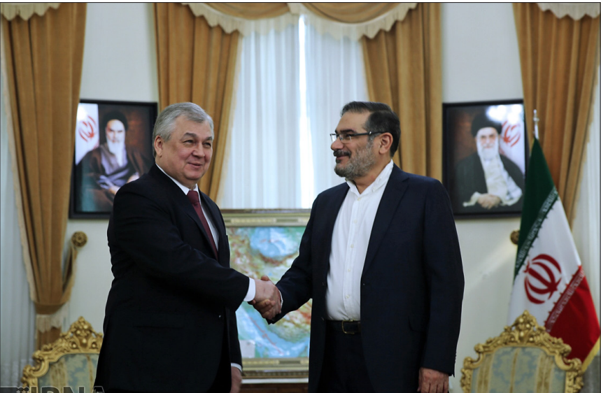
دیدار نماینده رئیس جمهور روسیه در امور سوریه با شمشانی