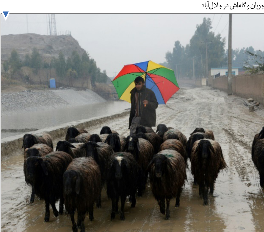
چوپان و گله‌اش در جلال‌آباد