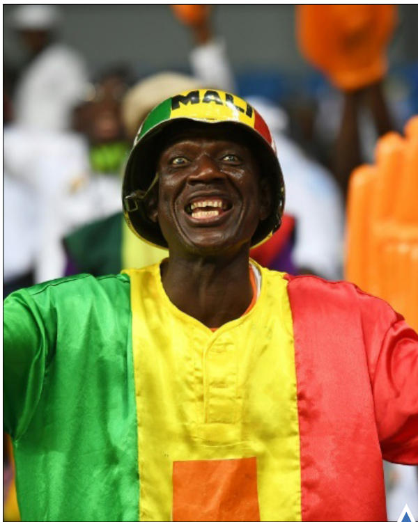
تشویق تیم فوتبال مالی در جام ملت‌های آفریقا

شیردریایی در حال بوسیدن شاهزاده موناکو در سیرک