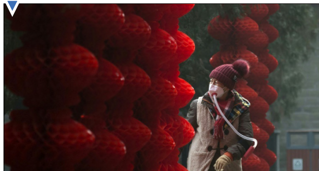
تزیینات سال نوی چینی با چاشنی آلودگی در پکن