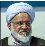
آیت الله هاشمی

حجت الاسلام غلامرضا مصباحی مقدم در مراسم بزرگداشت مرحوم آیت الله هاشمی، اظهار کرد: در تشییع پیکر مرحوم هاشمی مردم زیادی به خیابان‌ها آمدند که خدا به قدم‌هایشان خیر بدهد اما تعارف که نداریم بعضی از آن‌ها شعارهای عوضی می‌دادند و می‌خواستند هاشمی را از مقام معظم رهبری جدا کنند در صورتی که هاشمی لحظه‌ای خود را از آیت الله خامنه‌ای جدا نکرد و تا روز آخر گفت که عشق من آیت الله خامنه‌ای است. آن‌ها که به مرحوم هاشمی اهانت کردند توبه کنند و آن‌ها که قصدشان حذف هاشمی از نظام بود هم توبه کنند. ببینید مشی رهبر معظم انقلاب چیست. آن‌هایی که آقای هاشمی را در مقابل حضرت آقا علم می‌کنند هم توبه کنند چرا که هاشمی را نباید مقابل رهبری علم کرد و برایش علمی جدا برپا کرد.