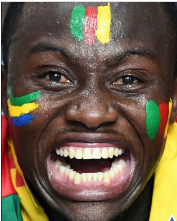
هوادار تیم کامرون در جام ملت‌های آفریقا