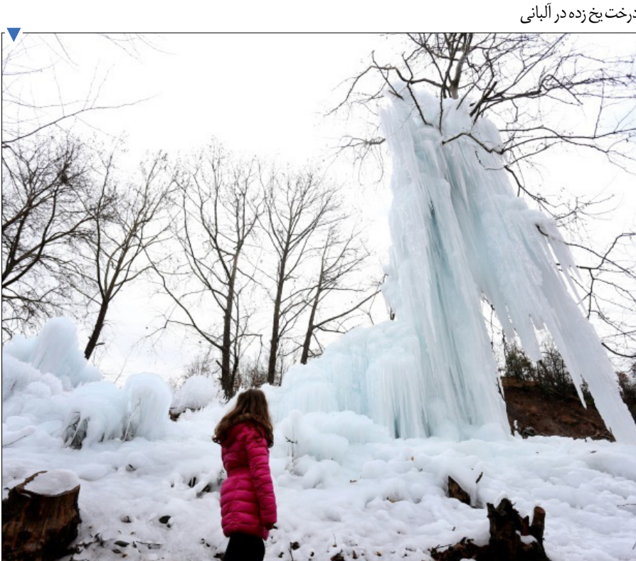
درخت یخ زده در آلبانی