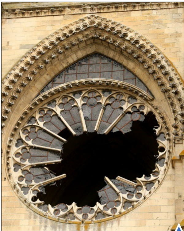
شکسته شدن شیشه کلیسای جامع در اثر باد تند در فرانسه