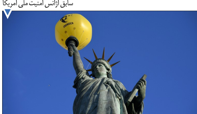
بادکنک با تصویر ادوارد استودن، کارمند سابق آژانس امنیت ملی آمریکا