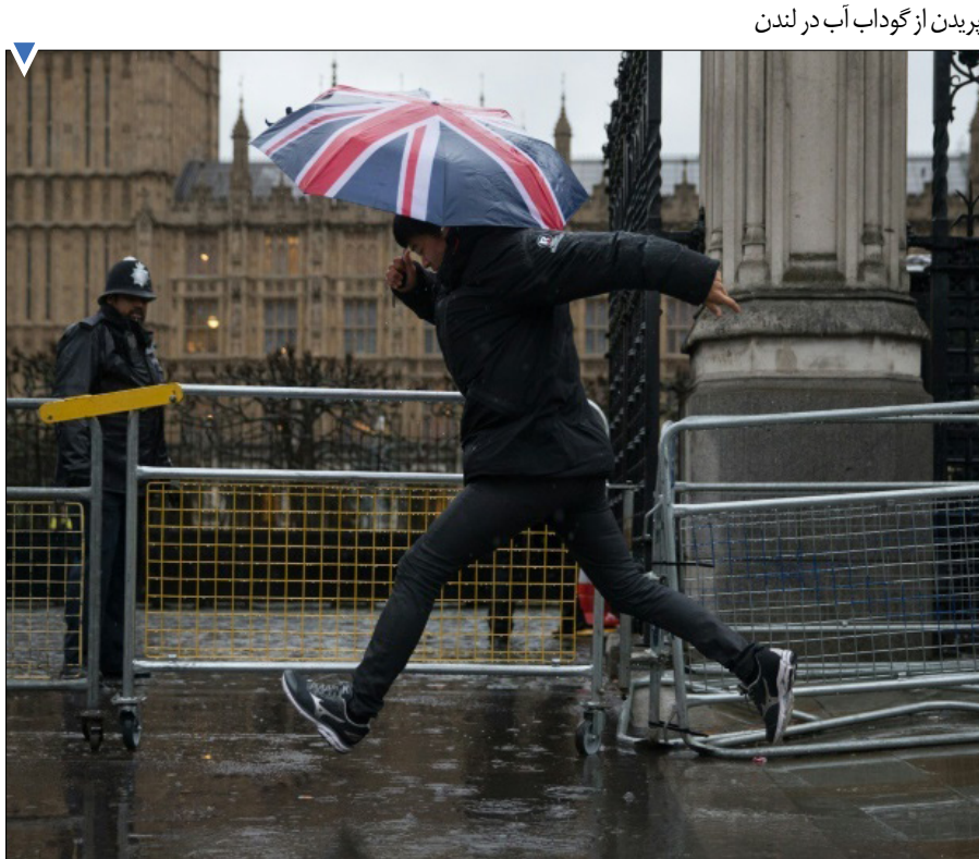
پریدن از گوداب آب در لندن