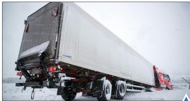
گیر افتادن کامیون در برف در غرب آلمان